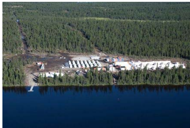
Mine uranifère Matoush