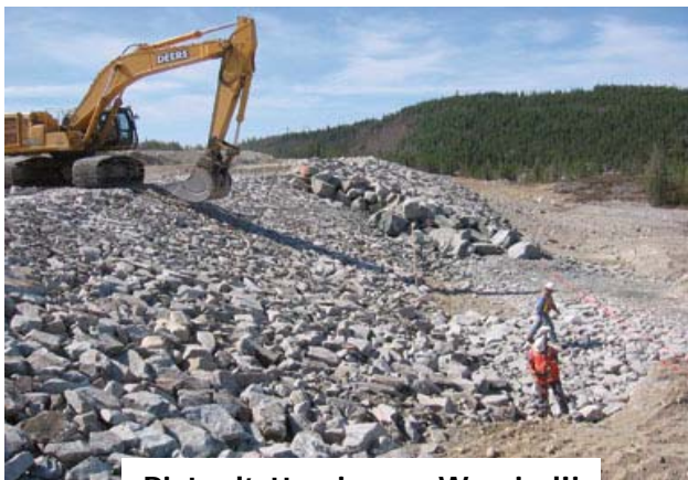
Piste d'atterrissage Wemindji